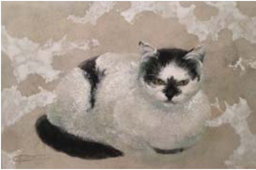
「やわらかな隣人」 P4号 22.0 x 33.3 cm 岩絵の具、顔料 和紙 2017年