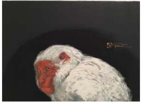
「申」 F4号 24.2 x 33.3 cm 岩絵の具、顔料 和紙 2014年