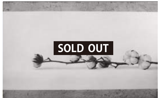
「cotton」 M10号 33.3 x 53.0 cm 油彩、鉛筆 キャンバス 2015年