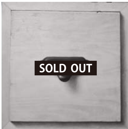
「空間侵食」 SSM 22.7 x 22.7 cm 油彩、鉛筆 板 2011年