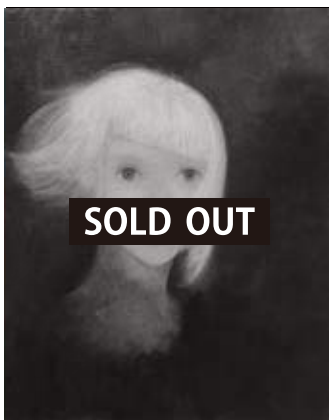
「white wig」 F3号 27.3 x 22.0 cm 油彩 キャンバス 2017年