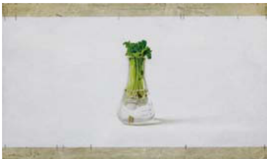
「gentle stress」 M8号 27.3 x 45.5 cm 油彩、鉛筆 キャンバス 2017年