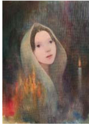
「veil」 F4号 33.3 x 24.2 cm 油彩 キャンバス 2017年