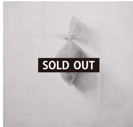
「synchronism」 S10号 53.0 x 53.0 cm 油彩、鉛筆 板 2016年