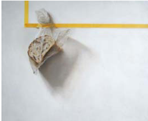
「食糧保存の法則」 F8号 38.0 x 45.5 cm 油彩、鉛筆 キャンバス 2013年