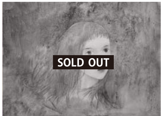
「red lips」 F4号 24.2 x 33.3 cm 油彩 キャンバス 2017年