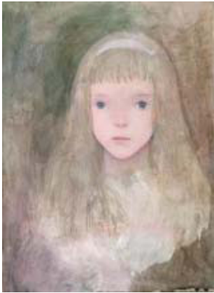
「white headband」 F4号 33.3 x 24.2 cm 油彩 キャンバス 2017年