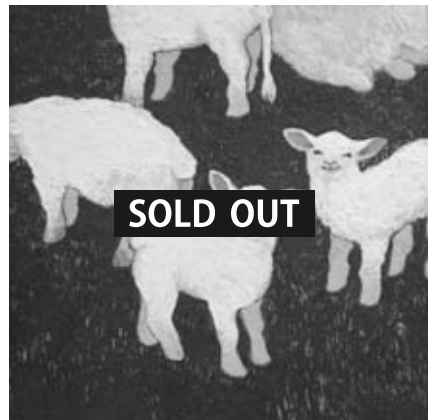
「みんなとても良い子たちで、」

変形 23.0 x 23.0 cm 岩絵具、カーボランダム リネン、白亜 2016年